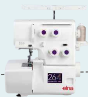
Overlock 264 UVP 529 € Upgrade-Aktion 469 €