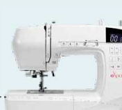
eXperience 570alpha UVP 1.039 € Eintauschpreis 899 €