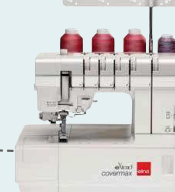
covermax UVP 1.199 € Upgrade-Aktion 999 €