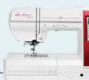
eXcellence 680+ fashion & decor UVP 1.499 € Eintauschpreis 1.299 € inkl. Bonus-Zubehör