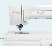
eXcellence 780+ UVP 3.349 € Eintauschpreis 2.999 €