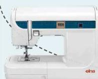
3210 Jeans UVP 669 € Eintauschpreis 599 €