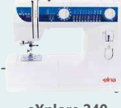
eXplore 240 UVP 449 € Eintauschpreis 399 €