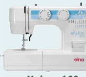
eXplore 160 UVP 339 € Eintauschpreis 299 €