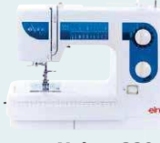
eXplore 320 UVP 559 € Eintauschpreis 499 €