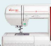
eXpressive 850 UVP 2.399 € Aktionspreis 2.099 €