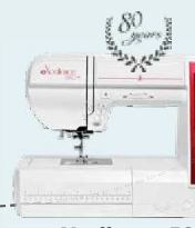
eXcellence 580+ anniversary UVP 1.299 € Eintauschpreis 1.149 € inkl. Bonus-Zubehör