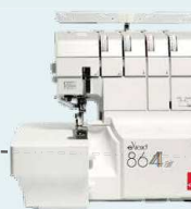
864air UVP 1.299 € Upgrade-Aktion 1.099 €