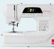
eXperience 450 UVP 449 € Eintauschpreis 389 €