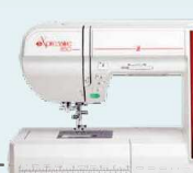
eXpressive 850 UVP 3.236 € Sparpaket 2.499 € inkl. Kreativ-Komplett-Set + Software eXuberance Junior