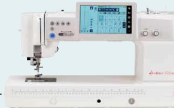
eXcellence 792PRO UVP 5.499 € Eintauschpreis 4.999 €