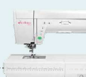
eXcellence 770 UVP 2.799 € Eintauschpreis 2.499 € inkl. Perfect-Fashion-Kit