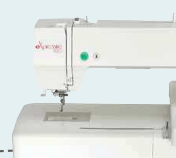
eXpressive 830 UVP 2.836 € Sparpaket 2.099 € inkl. Kreativ-Komplett-Set + Software eXuberance Junior