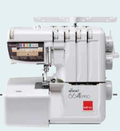
664PRO Vers. 2 UVP 849 € Upgrade-Aktion 749 €