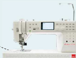
eXcellence 720PRO UVP 2.249 € Eintauschpreis 1.999 €