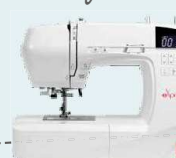
eXperience 550 UVP 819 € Eintauschpreis 699 €