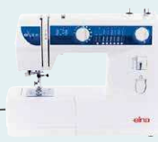
eXplore 220 UVP 419 € Eintauschpreis 369 €