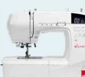
eXperience 560 UVP 929 € Eintauschpreis 799 €