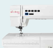
eXcellence 782 UVP 4.499 € Einführungspreis 3.999 €