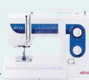
eXplore 340 UVP 619 € Eintauschpreis 549 €