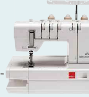
easyclover Vers. 2 UVP 849 € Upgrade-Aktion 699 €