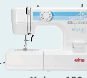
eXplore 150 UVP 299 € Eintauschpreis 269 €