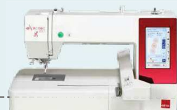
eXpressive 830L UVP 3.136 € Sparpaket 2.299 € inkl. Kreativ-Komplett-Set + Software eXuberance Junior