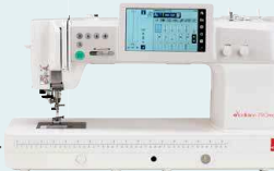
eXcellence 790PRO UVP 4.499 € Eintauschpreis 3.999 €