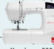
eXperience 530 UVP 699 € Eintauschpreis 599 €