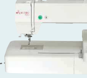
eXpressive 830 UVP 1.999 € Aktionspreis 1.699 €