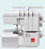
664 Vers. 2 UVP 679 € Upgrade-Aktion 599 €